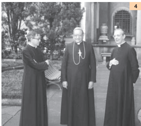
3 Plenaria del Concilio Vaticano II