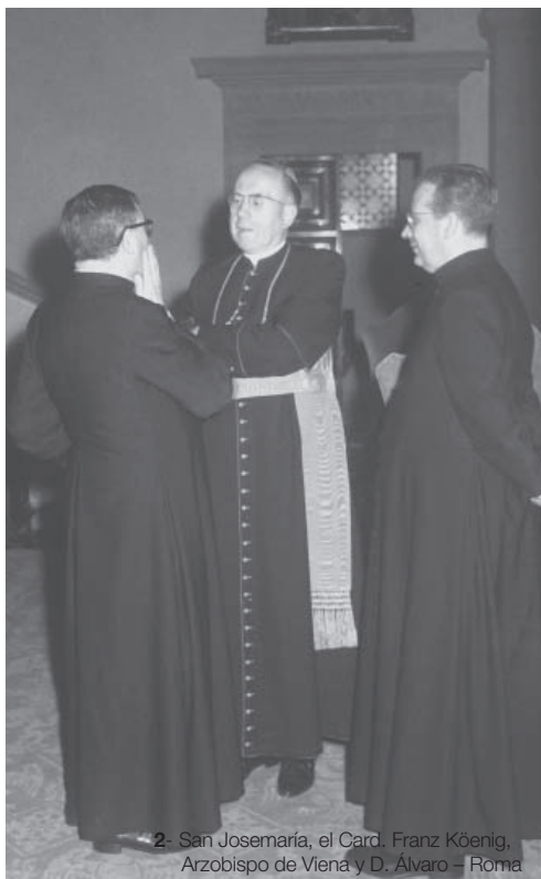
2. San Josemaría, el Card. Franz Köenig, Arzobispo de Viena y D. Álvaro - Roma

No es fácil describir el esfuerzo que supuso, para todos los miembros de la Comisión, realizar ese trabajo en un lapso de tiempo tan breve. Tampoco es sencillo imaginar la tarea que recayó sobre don Álvaro, Secretario de ese grupo de trabajo: coordinar la Comisión conciliar, formada por personalidades de relieve en el mundo eclesiástico y teológico, no era nada fácil. El Siervo de Dios supo escuchar las diversas propuestas, valorar los aspectos positivos de todas, reconducir las